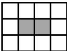
4 sloupce 3 řady